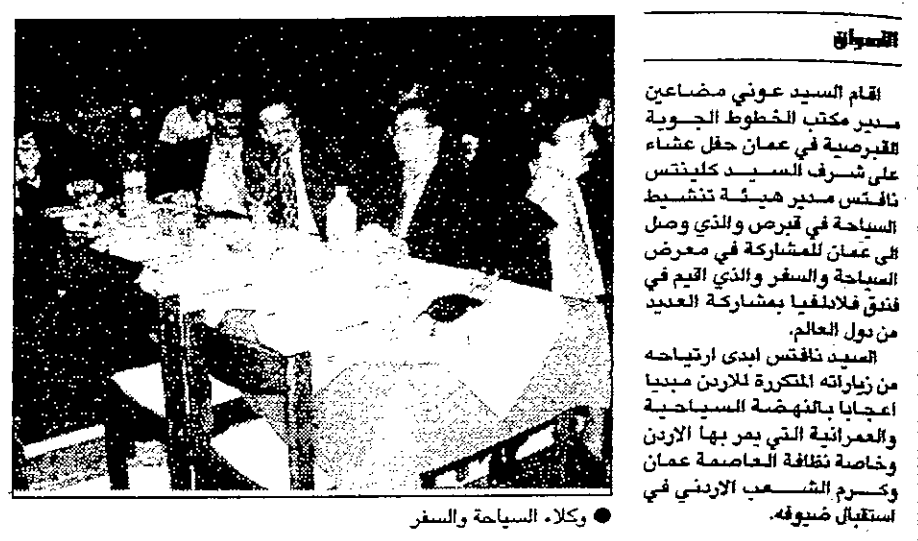
وكلاء السياحة والسفر